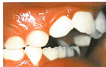
Omhoog gebogen tandenrij van de bovenkaak met naar achteren verplaatste positie van de onderlaag door duimen.

MUPPY® de correctiehulp moet door uw kind 's nachts altijd en beslist ook overdag urenlang (bijv. tijdens het maken van het huiswerk en tijdens het televisie kijken) worden gedragen.